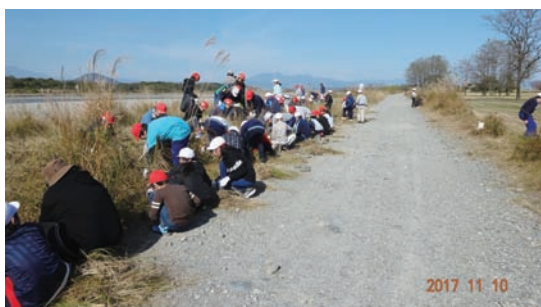
11/10 南小学校5年生の除草作業 (ゆうゆうパーク)