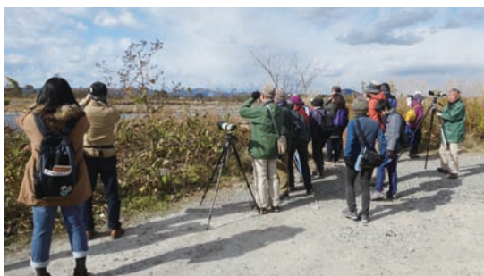
11/19 勝山探鳥会 (勝山の森・鬼怒川河川敷)