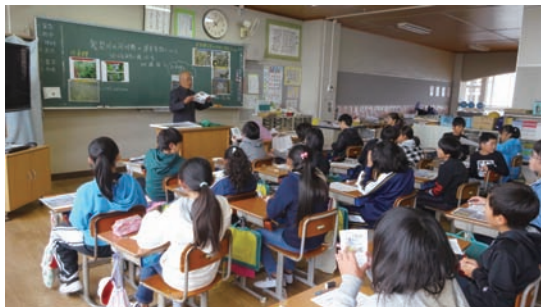
10/17 押上小学校5年生へ出前授業 (さくら市立押上小学校)