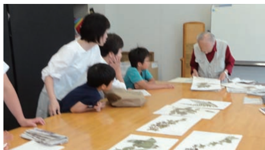
7/29 植物標本作り (ミュージアム)