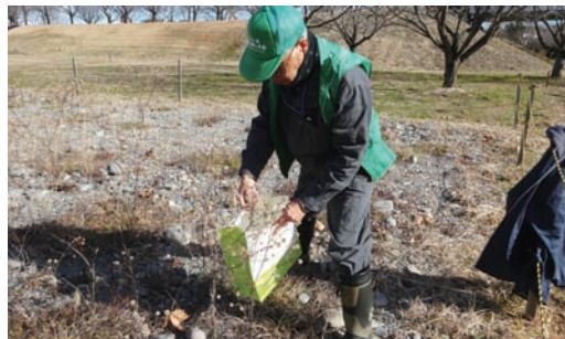
12/12 カワラノギク種取り (ミヤコグサ管理地)