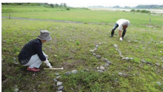
6/16～18 除草キャンペーン (ミヤコグサ管理地)