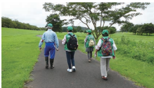
8/20 鬼怒川河川敷巡視活動 (鬼怒川河川敷)