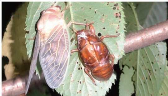
8/6 セミの羽化観察会 (ミュージアム)