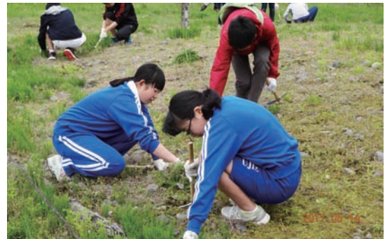
5/12～14 除草キャンペーン (ミヤコグサ管理地)