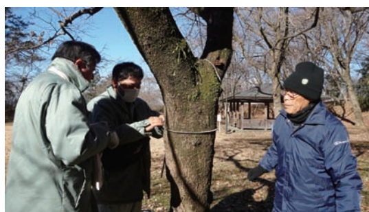
H30.1/11 勝山の森樹木へ名札付け (勝山の森)