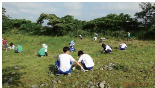
7/15～17 除草キャンペーン (ミヤコグサ管理地)