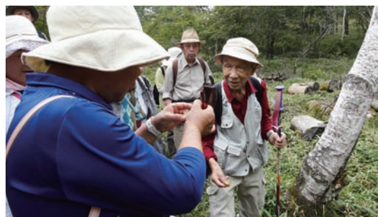
9/13 植物観察会 (横根高原井戸湿地)