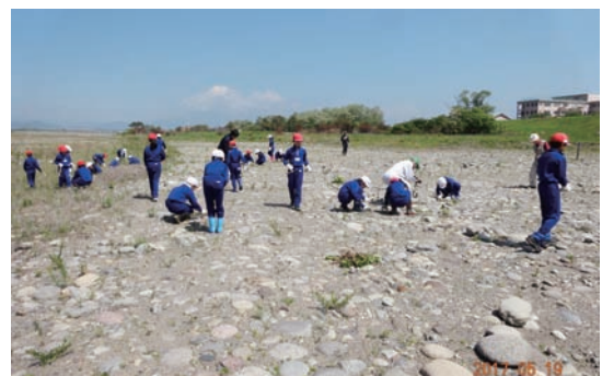
5/19 熟田小学校4年生の除草作業 (カワラノギク保全地)