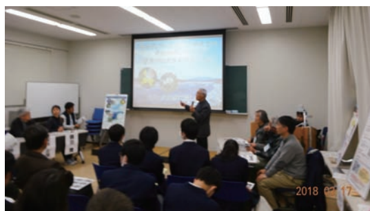
3/17 川の日ワークショップ関東大会 (筑波大)