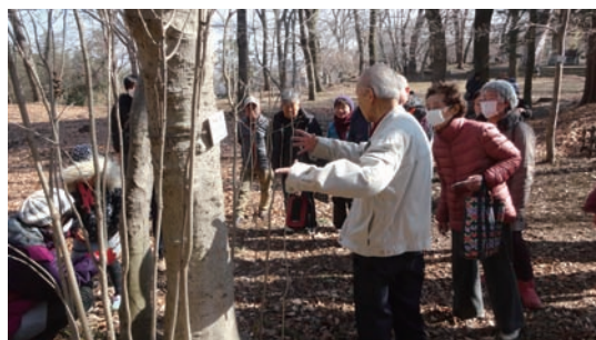
2/11 冬の植物観察会 (ミュージアム)