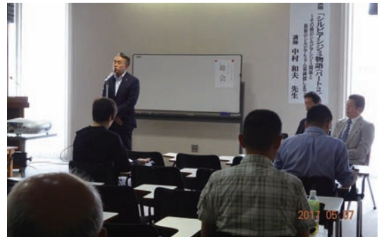
5/7 第15回定期総会 (ミュージアム講座室)