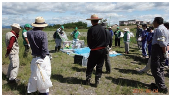
6/4 シナダレスズメガヤ抜き取り作業 (カワラノギク保全地)