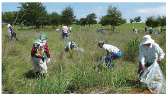
6/9 オオキンケイギク抜き取り作業 (ゆうゆうパーク)