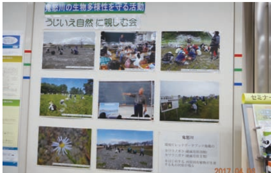
4/6～14 写真展 (三井住友信託銀行宇都宮支店ロビー)