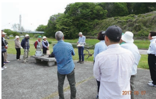
5/7 シルビアシジミ観察会 (ミヤコグサ管理地)