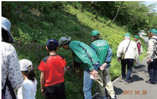
4/29 ヤマブキシソウ観察会 (お丸山公園)