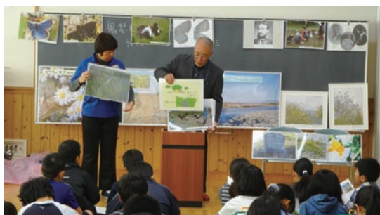
11/2 南小学校5年生へ出前授業 (さくら市立南小学校)