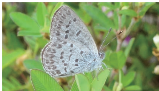
9/10 シルビアシジミ観察会 (倉吉市小鴨川)