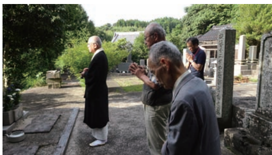
9/9 西蓮寺での墓参 (鳥取県湯梨浜町西蓮寺)