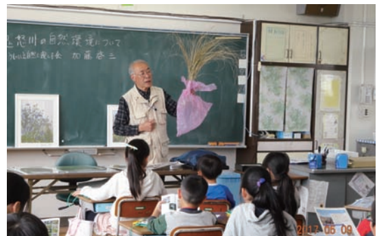
5/9 熟田小4年生へ出前授業 (さくら市立熟田小学校)