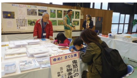
10/28～29 ゆめ! さくら博 (喜連川体育館)