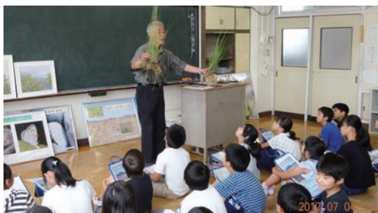
7/4 氏家小5年生へ出前授業 (さくら市立氏家小学校)