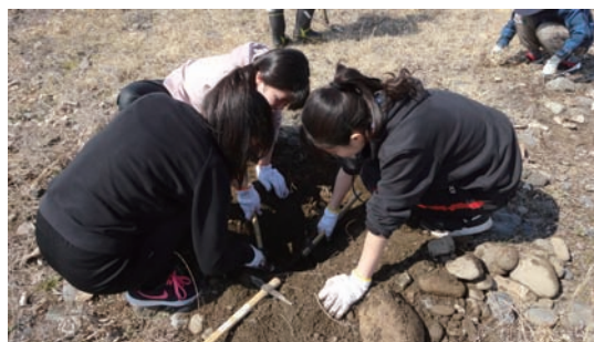
3/25 シナダレスズメガヤ抜き取り作業 (れき河原動植物保全地)