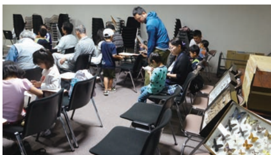
9/2 トンボの学習会 (ミュージアム)