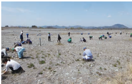
4/16 シナダレスズメガヤ抜き取り作業とカワラノギク種まき (カワラノギク保全地)