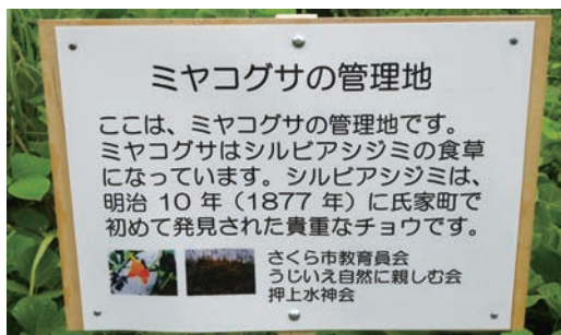
8/11 立て看板の設置 (鬼怒川河川敷)