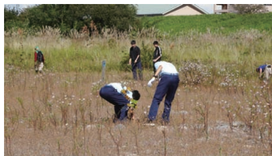
10/8 シナダレスズメガヤ抜き取り作業と カワラノギク観察会 (カワラノギク保全地)