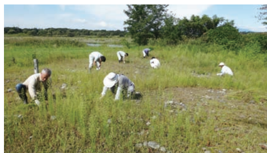
9/15～18 除草キャンペーン (ミヤコグサ管理地)