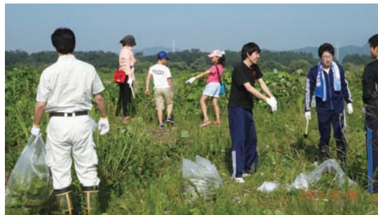
7/8 シナダレスズメガヤ抜き取り作業 (れき河原動植物保全地)