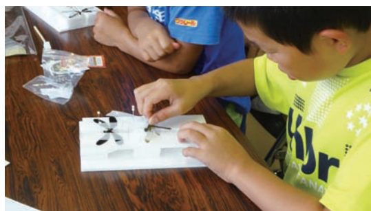
7/23 昆虫採集と昆虫標本作り (ミュージアム)