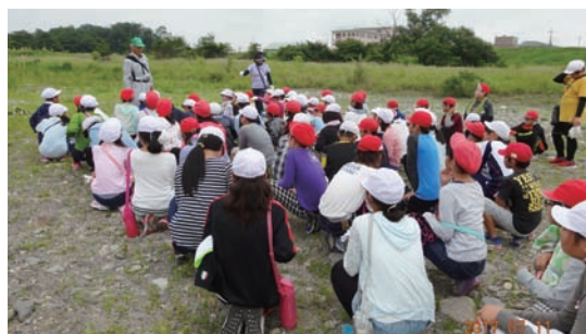
7/11 氏家小5年生の除草作業 (カワラノギク保全地)